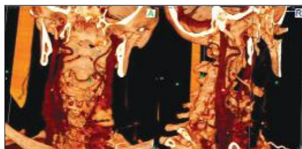
Ryc. 3b. Rekonstrukcja naczyń szyi w programie Osirix; materiał własny: a – płaszczyzna strzałkowa, b – płaszczyzna czołowa

Planując operacje w obrębie gardła i szyi, należy brać pod uwagę możliwość wystąpienia różnych wariantów anatomicznych przebiegu tętnicy szyjnej wewnętrznej. Jakkolwiek anomalie anatomiczne tego naczynia są dość powszechne, to jednak rzadko zdiagnozowane przed przystąpieniem do interwencji chirurgicznej. Krwawienia czy też krwotoki powstałe w wyniku przypadkowego uszkodzenia tętnicy szyjnej wewnętrznej mogą