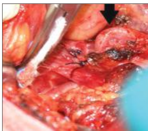
Ryc. 4. Anomalia przebiegu tętnicy szyjnej wewnętrznej – zdjęcie śródoperacyjne, materiał własny

być tragiczne w skutkach, dlatego operacje w tym rejonie powinno się wykonywać w sposób jak najbardziej staranny i ostrożny, po uprzednim dokładnym badaniu przedmiotowym i, na ile to możliwe, po wykonaniu pomocniczych badań obrazowych. Tomografia komputerowa z ewentualną trójwymiarową rekonstrukcją struktur anatomicznych szyi jest bardzo przydatnym badaniem, pozwalającym operatorowi przewidzieć zagrożenia i trudności związane z odmiennymi anatomicznymi w obrębie głowy i szyi. ●