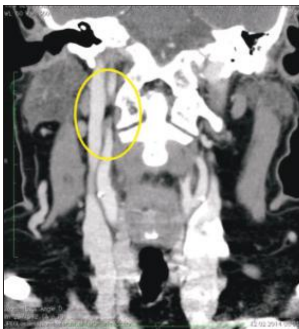
Ryc. 3a. Tomografia komputerowa szyi w przekroju czołowym. Odmienność anatomiczna – zakrzywiony przebieg tętnicy szyjnej wewnętrznej w odcinku zewnątrzczaszkowym (obwiedzione na żółto) - materiał własny

podżuchwową prawą. Ubytek kości żuchwy zrekonstruowano plastyczną protezą tytanową. Pacjentka została zakwalifikowana do dalszego leczenia uzupełniającego – radioterapią.