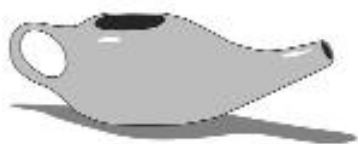
Ryc. 1. Dzbanek neti

Osoby początkujące mogą współczesny zabieg džalaneti wykonywać przy użyciu naczynia z dziobkiem, najlepiej o gładkich brzegach, nazywanego neti-pot (dzbanek neti ) (ryc. 1). Głowę należy przechylić w bok i trochę w dół, wprowadzić dziobek naczynia do otworu jamy nosa położonego przy tej pozycji wyżej, a następnie otworzyć usta i oddychać przez nie tak długo, aż woda zostanie zaaspirowana do jamy nosa, aby po chwili wypłynąć częściowo przez drugie nozdrze, a częściowo przez usta. Tę część się wypłukuje. Zabieg powtarza się, przechylając głowę w drugą stronę i wprowadzając wodę do drugiego otworu nosowego.